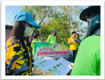
โครงการส่งเสริมการบริหารจัดการขยะมูลฝอยชุมชน