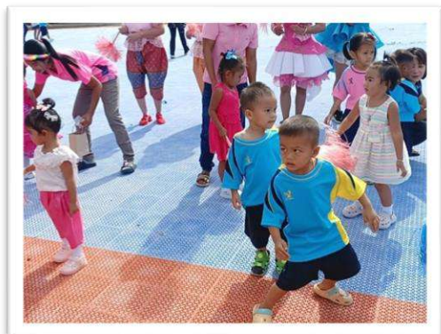
โครงการกีฬาปฐมวัยศูนย์พัฒนาเด็กเล็กสัมพันธ์