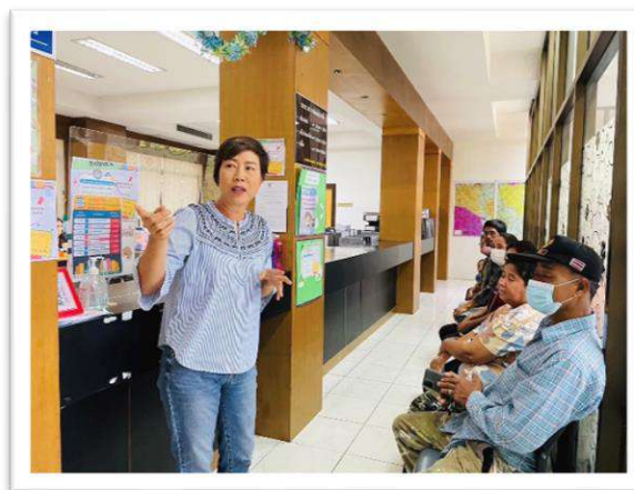
โครงการช่วยเหลือประชาชนผู้ประสบภัยในพื้นที่ตำบลหนองปรือ