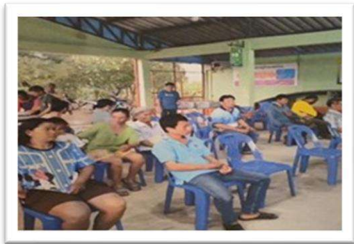
โครงการเงินอุดหนุนสำหรับการดำเนินงานตามแนวทางโครงการพระราชดำริด้านสาธารณสุข