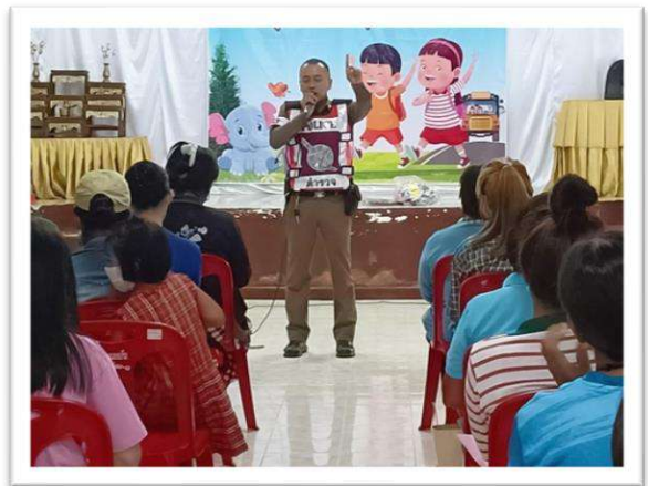
โครงการประชุมผู้ปกครองของศูนย์พัฒนาเด็กเล็ก