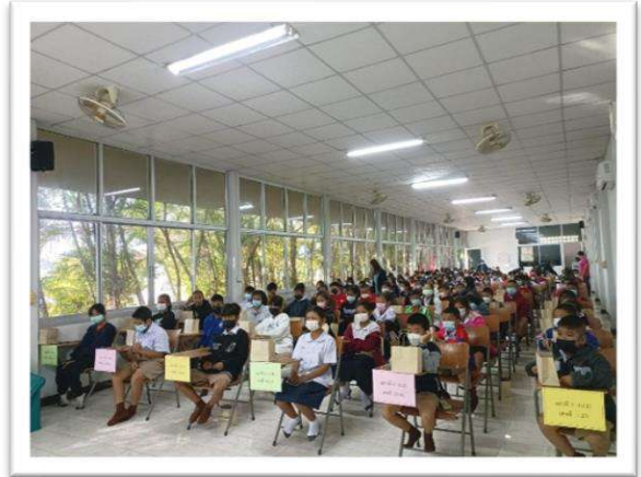
โครงการสอบชิงทุนการศึกษา