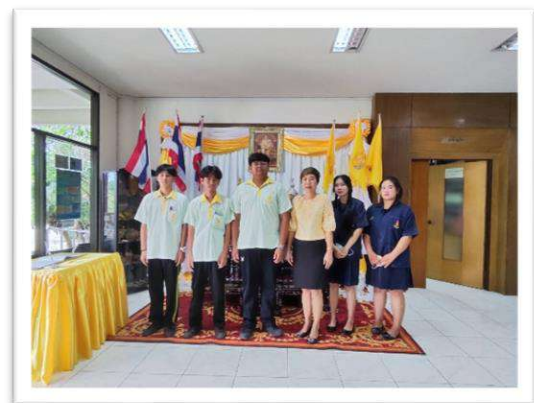
โครงการเฉลิมพระชนมพรรษา ๒๘ กรกฎาคม พระบาทสมเด็จพระปรเมนทรรามาธิบดีศรีสินทรมหาวชิราลงกรณพระวชิรเกล้าเจ้าอยู่หัว รัชกาลที่ ๑๐