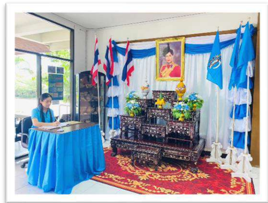
โครงการเฉลิมพระชนมพรรษา ๑๒ สิงหาคม สมเด็จพระนางเจ้าสิริกิติ์ พระบรมราชินีนาถ พระบรมราชชนนีพันปีหลวง