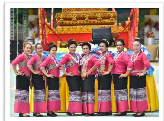
โครงการสืบสานวัฒนธรรมท้องถิ่นประเพณีแห่ปราสาทผึ้ง