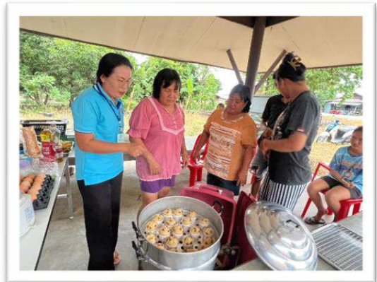
โครงการส่งเสริมกลุ่มอาชีพแปรรูปผลผลิตทางการเกษตรตำบลหนองปรือ