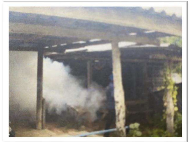
โครงการรณรงค์ป้องกันและควบคุมโรคไข้เลือดออก