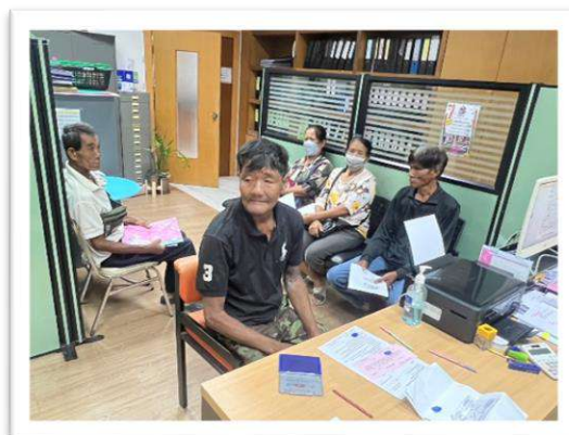
งานด้านสวัสดิการสังคม ส่งเสริมคุณภาพชีวิต ผู้สูงอายุ ผู้ป่วยเอดส์