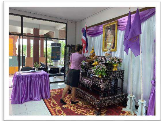
โครงการเฉลิมพระชนมพรรษาสมเด็จพระนางเจ้าสุทิดาพัชรสุธาพิมลลักษณพระบรมราชินี