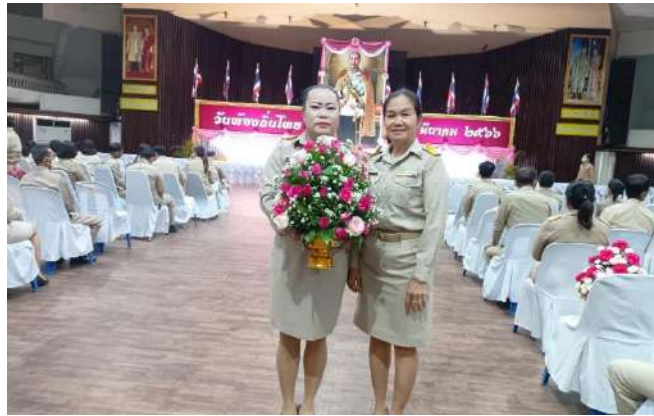
โครงการวันท้องถิ่นไทย