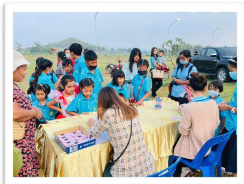
โครงการส่งเสริมเด็กไทย อนาคตไทย ในวันเด็กแห่งชาติ