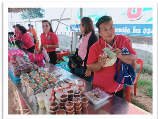
โครงการบริหารจัดการตลาดอบต.หนองปรือ