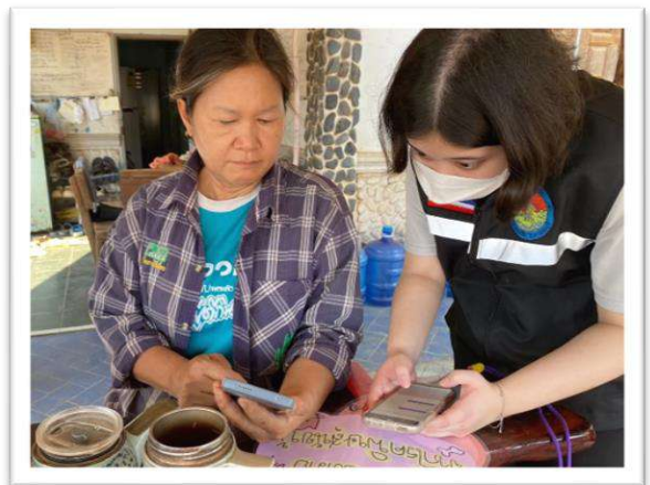
โครงการสัตว์ปลอดโรค คนปลอดภัย จากโรคพิษสุนัขบ้า