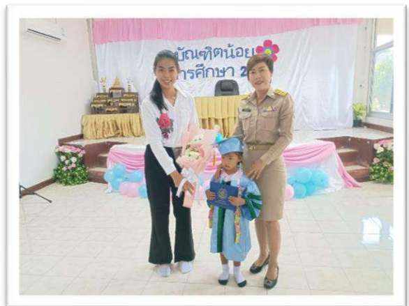
โครงการสานสัมพันธ์มุ่งสู่ฝันการศึกษา